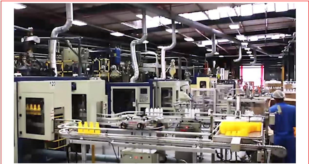
ייצור בקבוקי פלסטיק במכונות ניפוח.